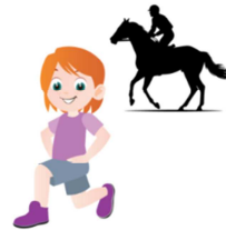
POSTURE DU CAVALIER