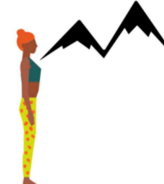
POSTURE DE LA PETITE MONTAGNE