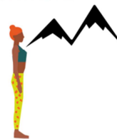
POSTURE DE LA PETITE MONTAGNE