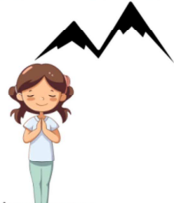
POSTURE DE LA MOYENNE MONTAGNE