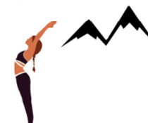
POSTURE DE LA GRANDE MONTAGNE