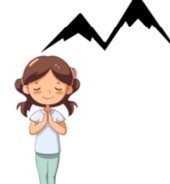
POSTURE DE LA MOYENNE MONTAGNE