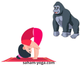
POSTURE DE LA PIÏCE DEBOUT POSTURE DU GORILLE