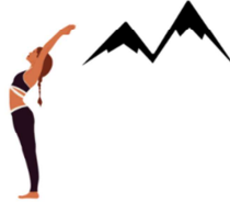
POSTURE DE LA GRANDE MONTAGNE