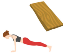
POSTURE DE LA PLAICHE