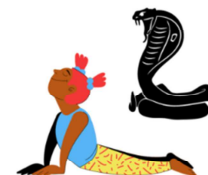
POSTURE DU COBRA