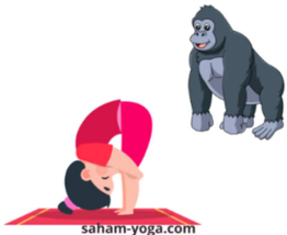
POSTURE DE LA PIÏCE DEBOUT POSTURE DU GORILLE