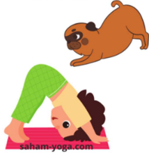
POSTURE DU CHIEN TÊTE EN BAS