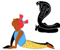
POSTURE DU COBRA