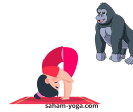
POSTURE DE LA PIÏCE DEBOUT POSTURE DU GORILLE