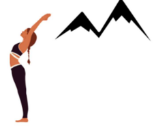
POSTURE DE LA GRANDE MONTAGNE