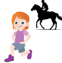
POSTURE DU CAVALIER