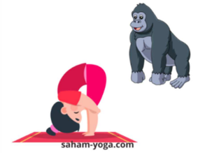
POSTURE DE LA PIÏCE DEBOUT POSTURE DU GORILLE